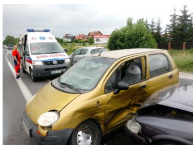
Znaleźli się w odpowiednim miejscu i czasie

Pracujący na miejscu wypadku patrol Policji stwierdził, że kierujący oplem - sprawca wypadku - nie posiada uprawnień do prowadzenia pojazdów.