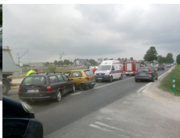
Znaleźli się w odpowiednim miejscu i czasie