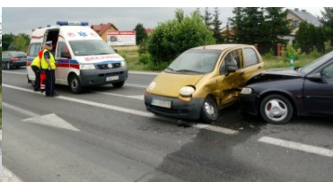
Znaleźli się w odpowiednim miejscu i czasie