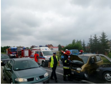
Znaleźli się w odpowiednim miejscu i czasie