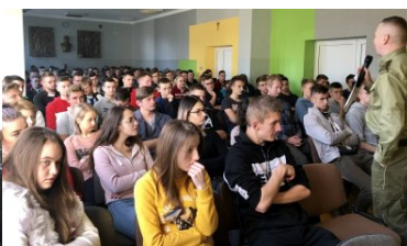
„19 Dni Przeciwno Krzywdzeniu Dzieci i Młodzieży” - Funkcjonariusz PSG Zakopane podczas spotkania