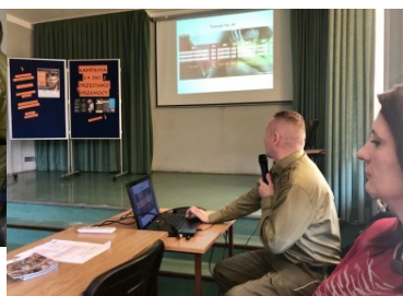
„19 Dni Przeciwno Krzywdzeniu Dzieci i Młodzieży” - Funkcjonariusz PSG Zakopane podczas spotkania