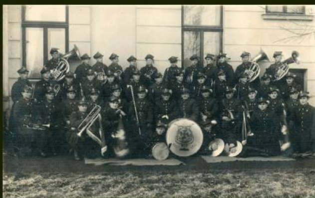
Orkiestra 1 PSP przed budynkiem koszar, 1937 r.