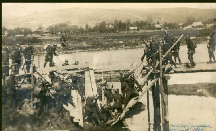
Przeprawa przez most, Nowy Sącz, 1925 r.