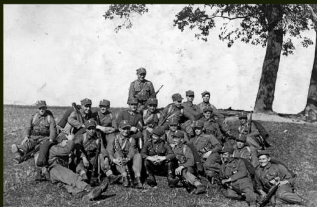
Żołnierze 1 PSP w letnich mundurach polowych (wzór munduru z roku 1937).