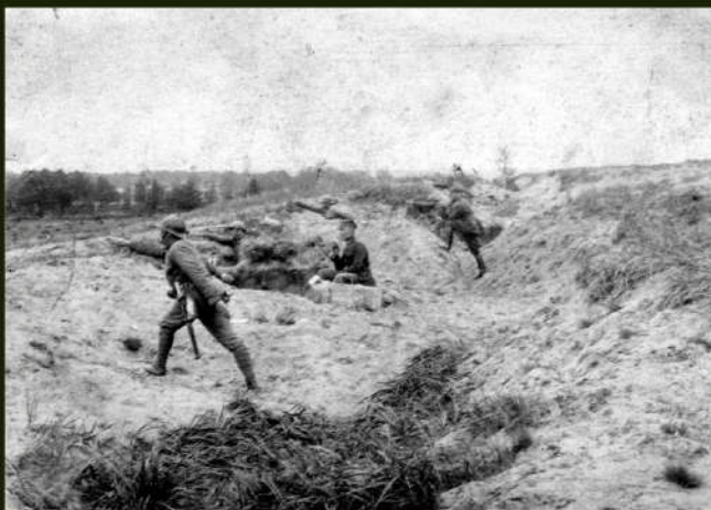
Ćwiczenia w 1 PSP – rzut granatem, l. 20.