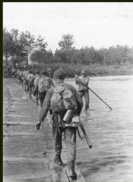
Przejsie brodu z użyciem kładek pionierskich, l. 30.