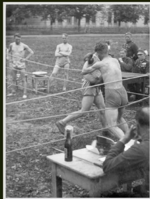
Mecz bokserski na prowizorycznym ringu na placu koszarowym 1 PSP, l. 30.