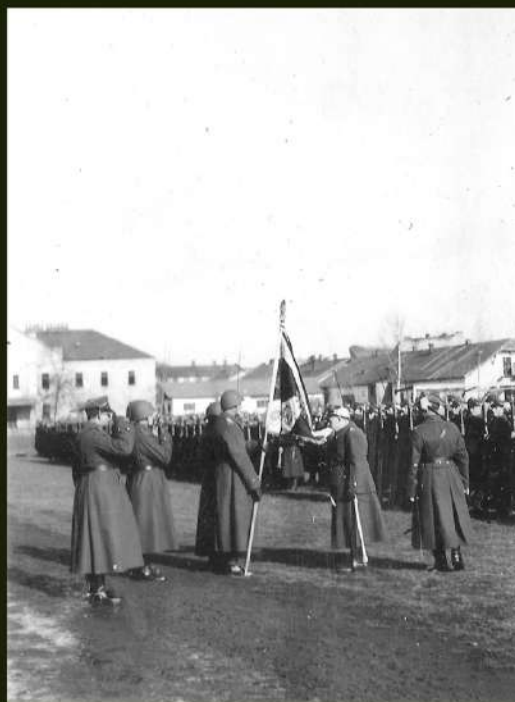
Płk dypl. Alfred Krajewski honoruje sztandar w czasie uroczystości objęcia dowództwa pułku, 13 lutego 1938 r.