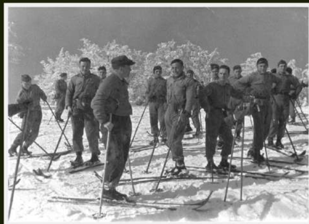
Szkolenie narciarskie w 1 PSP, l. 30.