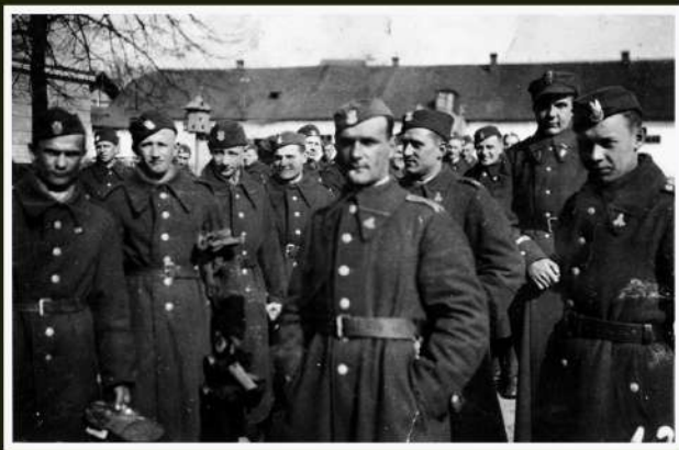
Na dziedzińcu koszar, po 1937 r.