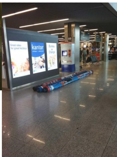
Tyczki pozostawione na lotnisku