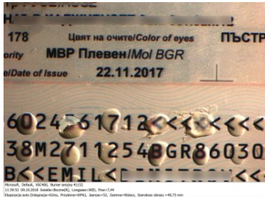
Fałszywe dokumenty ob. Iranu