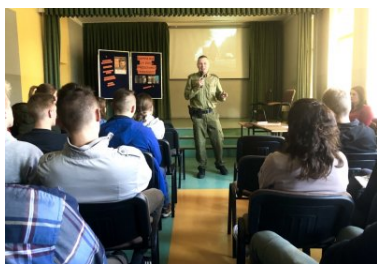
„19 Dni Przeciwko Krzywdzeniu Dzieci i Młodzieży” - Funkcjonariusz PSG Zakopane podczas spotkania

Organizatorem 19-dniowej akcji jest Women’s World Summit Foundation – genewska organizacja zajmująca się prawami dzieci i kobiet. Głównym celem kampanii jest budowanie świata, w którym nie ma przemocy wobec dzieci i młodzieży. Świata, gwarantującego wszystkim odpowiednie warunki dorastania i rozwoju. Wczorajsze spotkanie funkcjonariusza SG z młodzieżą, odbyło się na zaproszenie szkoły, która włączyła się do ww. akcji.