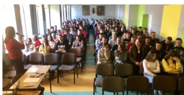
„19 Dni Przeciwko Krzywdzeniu