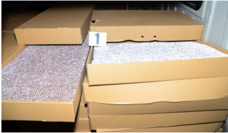
Kontrabanda dużej wartości zatrzymana przez KaOSG