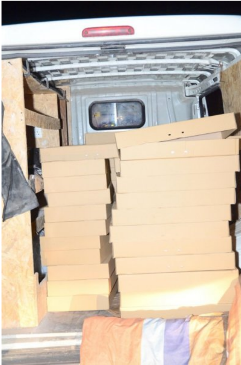
Kontrabanda dużej wartości