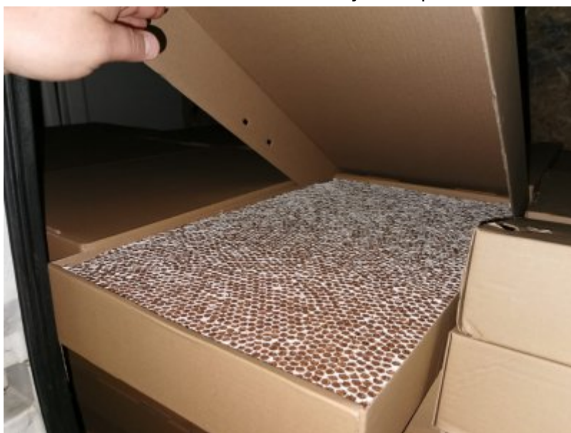
Kontrabanda dużej wartości