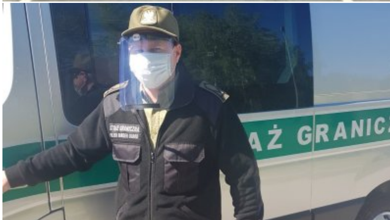
W Trosce o bezpieczeństwo