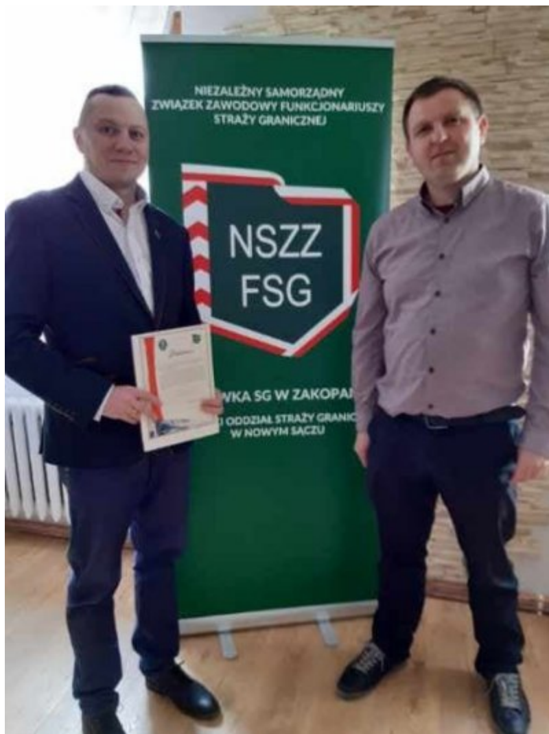
W Trosce o bezpieczeństwo