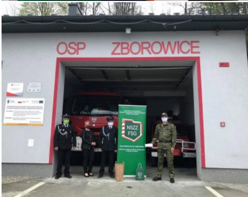
W Trosce o bezpieczeństwo