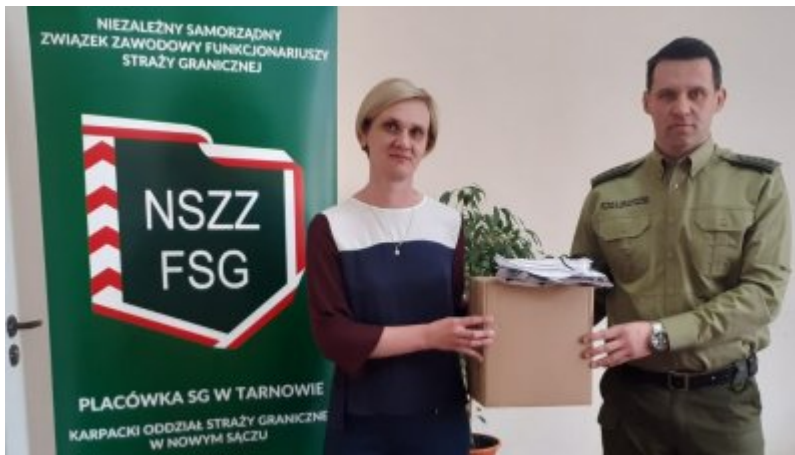
W Trosce o bezpieczeństwo

W tym miejscu pragniemy podziękować wszystkim instytucjom oraz osobom, które wspierają działania Karpackiego Oddziału Straży Granicznej w czasie epidemii. Dzięki bezinteresownej pomocy, którą otrzymujemy, jesteśmy w stanie bezpiecznie wykonywać swoje obowiązki, a tym samym zapewnić bezpieczeństwo nas wszystkich.