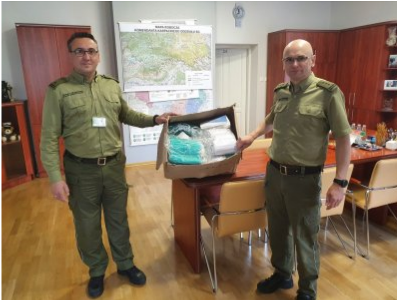
W trosce o bezpieczeństwo