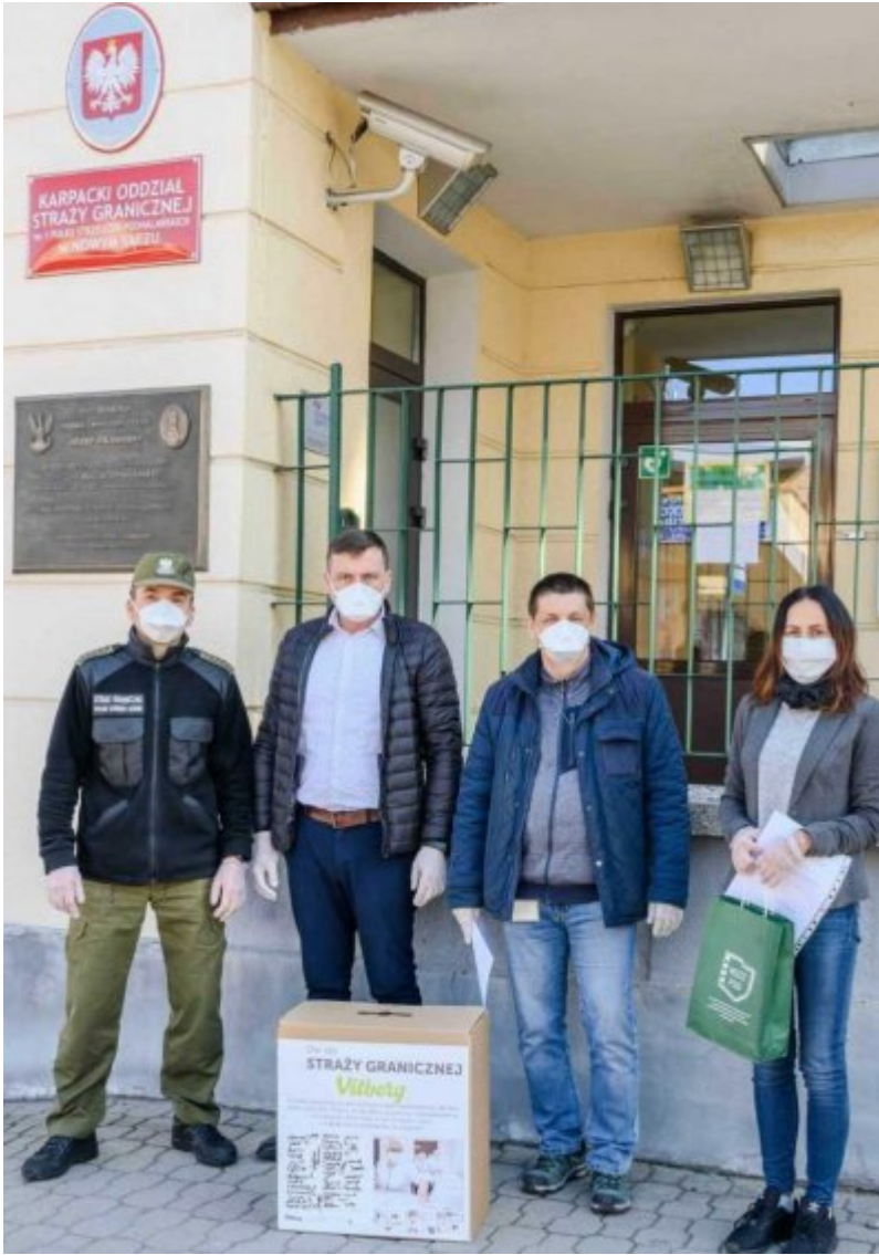
W Trosce o bezpieczeństwo