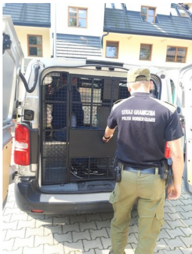
Figurowali w wykazie osób niepożądanych na terytorium RP