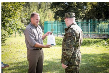
Akcja SadziMy w KaOSG

Nadleśnictwo Stary Sącz przygotowało 2200 sadzonek dębów i świerków, które są rozdawane w ramach wspomnianego przedsięwzięcia.