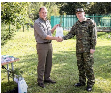
Akcja SadziMy w KaOSG