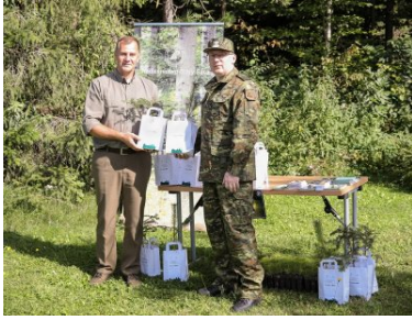
Akcja SadziMy w KaOSG