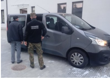
Wyszedł z więzienia i wróci na Ukrainę