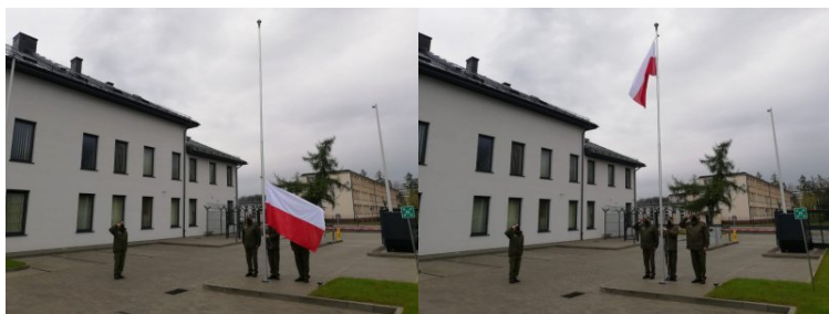
Flagę państwową - PODNIEŚĆ!

Ten ważny dla każdego Polaka dzień, postanowili również uczcić funkcjonariusze z Placówki SG w Tarnowie. Na maszt przed tarnowską Placówką z honorami wciągnięta została biało-czerwona flaga.