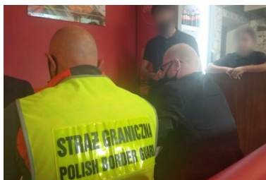
Handel ludźmi - nie bądźmy obojętni!

Portal o przeciwdziałaniu handlowi ludźmi: https://www.gov.pl/web/handel-ludzi