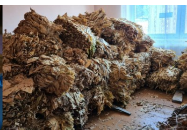
Ponad 2 tony wyrobów akcyzowych zatrzymanych w Ostrowcu Świętokrzyskim