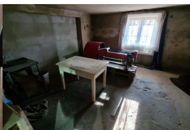
Ponad 2 tony wyrobów akcyzowych zatrzymanych w Ostrowcu Świętokrzyskim