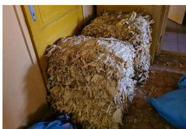
Ponad 2 tony wyrobów akcyzowych zatrzymanych w Ostrowcu Świętokrzyskim