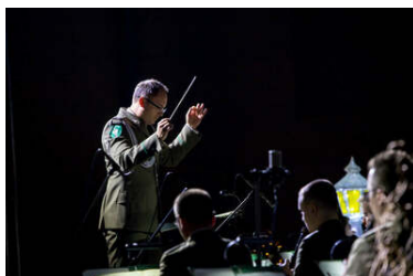
fot. MGOK w Muszynie