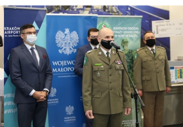
Specjalistyczny sprzęt trafił do PSG w Krakowie-Balicach