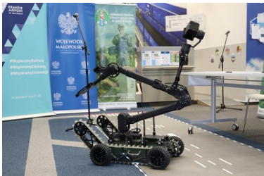
Specjalistyczny sprzęt trafił do PSG w Krakowie-Balicach

Placówka Straży Granicznej w Krakowie-Balicach od dziś może pochwalić się nowym, zaawansowanym technologicznie sprzętem: lekkim robotem pirotechnicznym PIAP GRYF oraz elektrycznym pojazdem marki Nissan. Po ambulansie pirotechnicznym oraz bramkach do automatycznej odprawy granicznej (ABC), to kolejny zakup sfinansowany przez Wojewodę Małopolskiego i przekazany Placówce Straży Granicznej w Krakowie-Balicach w ciągu ostatnich 5 miesięcy. Tym samym zainwestowano w bezpieczeństwo i elektromobilność.