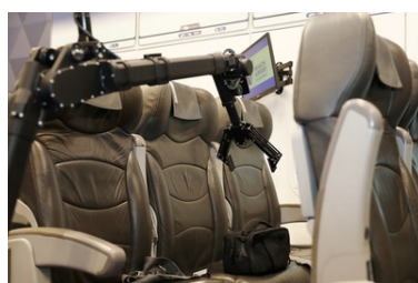
Specjalistyczny sprzęt trafił do