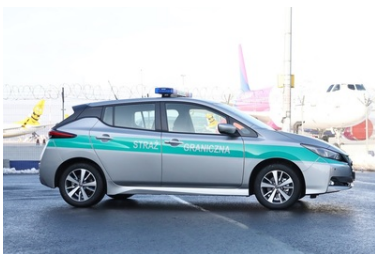
Specjalistyczny sprzęt trafił do PSG w Krakowie-Balicach

Główne zalety GRYFA to jego gabaryty i waga – niespełna 50 kg, zwrotność, a także manipulator o pięciu stopniach swobody, które umożliwiają przenoszenie przedmiotów o wadze do 15 kg. Podkreślić należy też łatwość transportu, pokonywanie schodów (trapy statków powietrznych), czy też możliwość szybkiego demontażu kół, które pomagają w prowadzeniu działań w wąskich przestrzeniach, w tym na pokładach samolotów. Modułowa konstrukcja urządzenia pozwala na montaż dodatkowych elementów (między innymi bezodrzutowego wyrzutnika pirotechnicznego, strzelb samopowtarzalnych i powtarzalnych), czy też łatwą zmianę konfiguracji. Ciekawym elementem wyposażenia jest też tak zwany bank narzędzi.