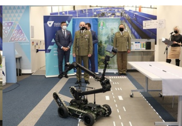
Specjalistyczny sprzęt trafił do PSG w Krakowie-Balicach