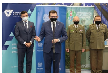
Specjalistyczny sprzęt trafił do PSG w Krakowie-Balicach

Całkowity koszt zakupionego sprzętu to ponad 800 tysięcy złotych.