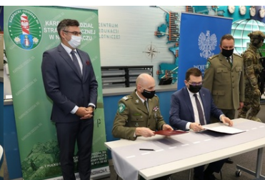
Specjalistyczny sprzęt trafił do PSG w Krakowie-Balicach