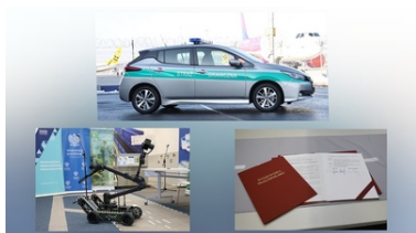
Specjalistyczny sprzęt trafił do PSG w Krakowie-Balicach

Link do briefingu prasowego w udziale Łukasza Kmity Wojewody Małopolskiego - źródło Małopolski Urząd Wojewódzki