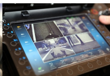
Specjalistyczny sprzęt trafił do