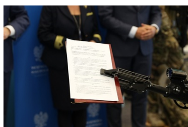
Specjalistyczny sprzęt trafił do PSG w Krakowie-Balicach