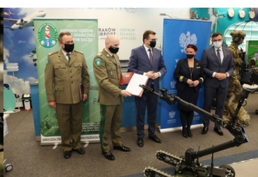
Specjalistyczny sprzęt trafił do PSG w Krakowie-Balicach