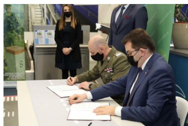
Specjalistyczny sprzęt trafił do PSG w Krakowie-Balicach