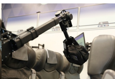
Specjalistyczny sprzęt trafił do