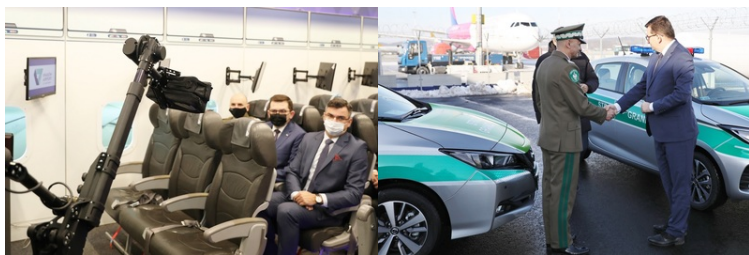
Specjalistyczny sprzęt trafił do PSG w Krakowie-Balicach