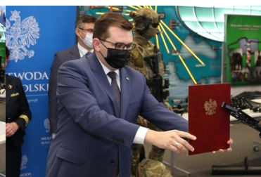
Specjalistyczny sprzęt trafił do PSG w Krakowie-Balicach