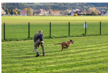
Psy saperskie znów pojedą do Ukrainy