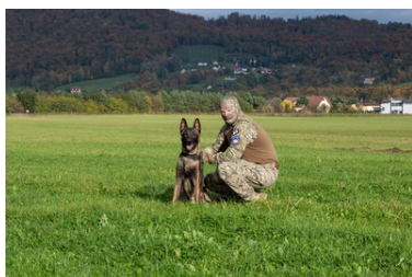
Psy saperskie znów pojedą do Ukrainy