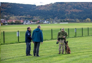
Psy saperskie znów pojedą do Ukrainy