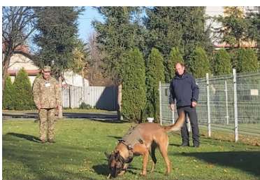
Psy saperskie znów pojadą do Ukrainy