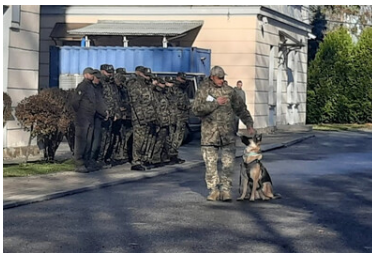
Psy saperskie znów pojadą do Ukrainy