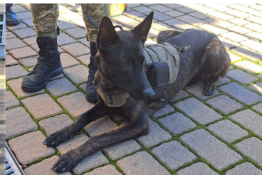
Psy saperskie znów pojadą do Ukrainy