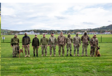
Psy saperskie znów pojedą do Ukrainy