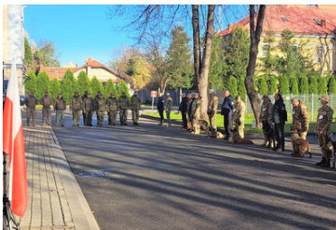
Psy saperskie znów pojadą do Ukrainy

Komisja Europejska przekazała również ukraińskim siłom zbrojnym drony do wykrywania metali, które zostaną wykorzystane do wsparcia pracy psów saperskich, zwłaszcza na dużych terenach, na których proces rozminowywania trwa bardzo długo.