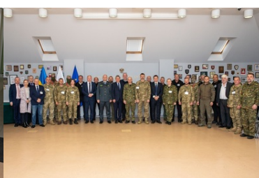
Psy saperskie znów pojadą do