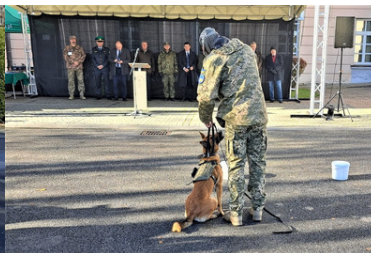
Psy saperskie znów pojadą do Ukrainy