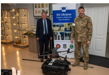
Psy saperskie znów pojadą do