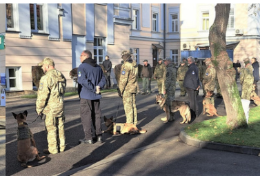
Psy saperskie znów pojadą do Ukrainy