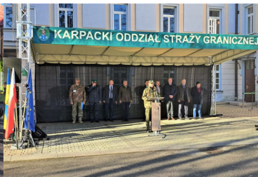
Psy saperskie znów pojadą do Ukrainy